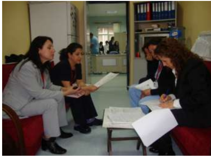
İl Sağlık Müdürlüğü Kalite denetimi

Hizmet Kalitesi Standartları kapsamında her altı ayda bir olmak üzere Kalite Yönetim Birimi tarafından Öz Değerlendirmeler yapılmaktadır. Değerlendirme sonuçlarının raporu, Üst Yönetime sunulmaktadır. Kalite Yönetim Direktörünün de katıldığı Yönetimin gözden geçirme toplantılarında değerlendirilmekte, hedefler belirlenmekte ve görev dağılımları yapılmaktadır.