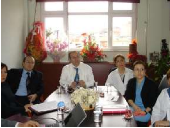
Resim. İlk Kalite çalışmalarımız.