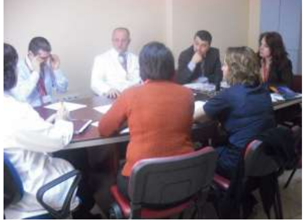
Resim. Kalite ve Performans konsey çalışmaları.