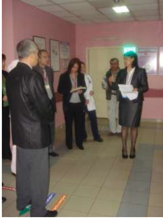
Bakanlık Kalite Denetimi

Sağlık Bakanlığı Öz Değerlendirme ekipleri veya İl Kalite Koordinatörlüğü ekipler tarafından her dönem Hizmet Kalitesi Standartları Öz Değerlendirmeleri yapılmaktadır.